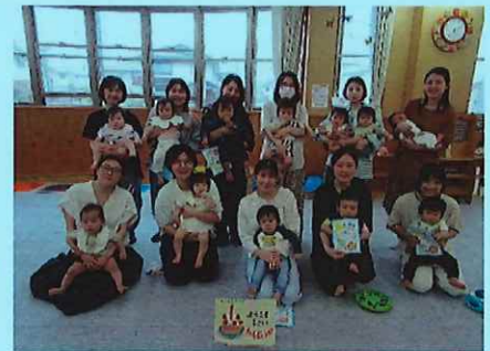
和やかでゆったりとした赤ちゃんとの時間です。

産後のお母さんたちのちょっとした心配や気がかりな事に助産師さんが相談にのってくださいます。